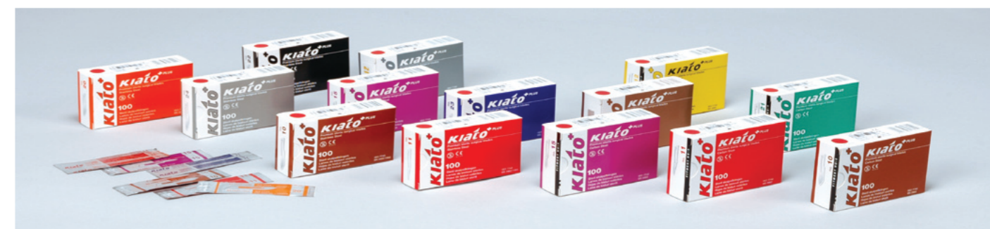
100 blad per ask. 10 askar per låda. 10 lådor per kolla.