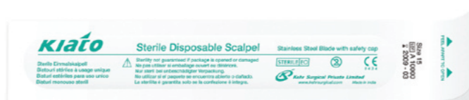
Ligger i separata lättöppnade förpackningar. 10 skalpeller per ask.