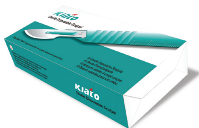
Askar färgmärkta för lätt identifikation. 10 askar per låda